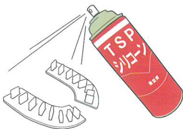
シリコン（離型剤）塗布

作業を開始する前にシリコンスプレーを吻合部位プレートの裏（ビン）側、またはベース（裏側）に塗布してください。摩擦を感じず、安定した操作性と納まりの良さ（精密さ）を実感していただけます。